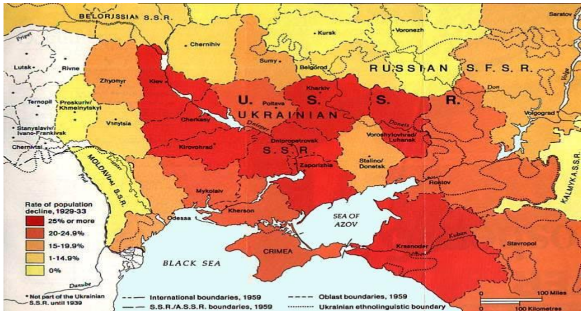
Obrázok 1 Hladomor v rokoch 1929-1933 na Ukrajinu

Zdroj: https://dennikn.sk/3128535/ukrajinsky-hladomor-stalinistica-genocida-a-kontext-prebiehajucej-ruskej-agresie/