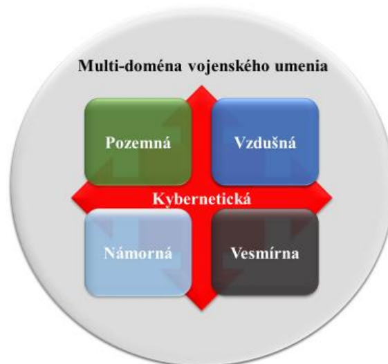
Obrázok 1 Multi-doména vojenského umenia

Vojenské umenie je definované ako uvážlivé uplatňovanie vojenskej vedy v konkrétnych podmienkach. Vojenské umenie má svoj vedecký základ v teórii vojenského umenia. Vojenské umenie sa zaoberá skúmaním metód a dizajnu vojenských činností v rozmanitej dimenzii, plánovania a realizácii ozbrojeného konfliktu v pozemnej, vzdušnej, námornej, vesmírnej (kozmickej) či kybernetickej doméne. Vojenské umenie zahŕňa vojenskú stratégiu, operačné umenie a vojenskú taktiku. (SVD 30, 2006)