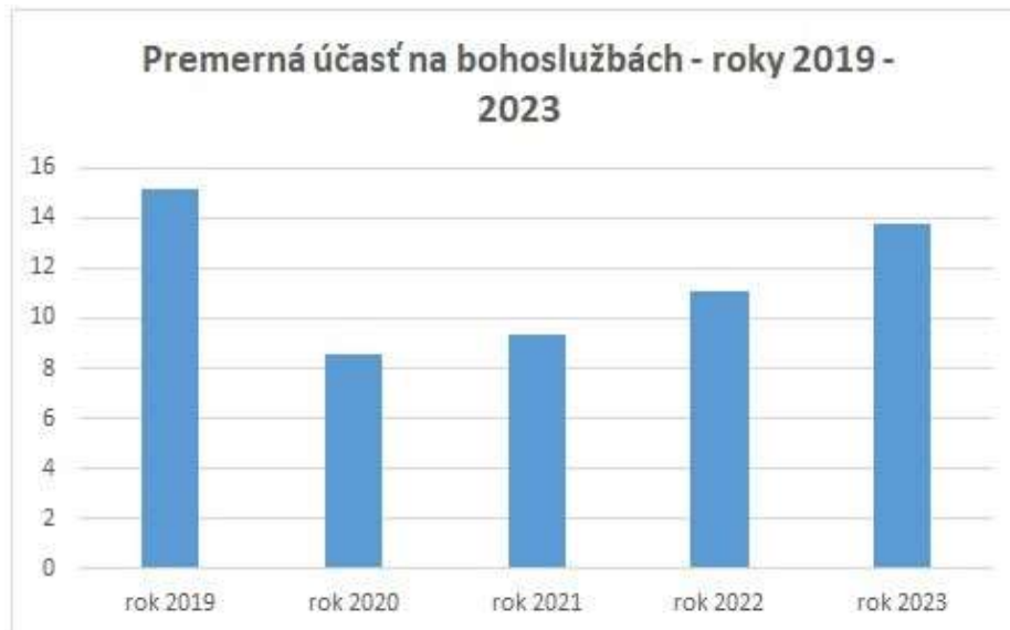
Graf 2 Priemerná účasť veriacich na bohoslužbách za obdobie rokov 2019 – 2023 Zdroj: vlastné spracovanie

V tomto bode sa môže vynoriť otázka, či dobrý kresťan je zároveň dobrý vojak? Odpovedať na danú otázku je nesmierne zložité a zasluhuje si oveľa väčší priestor na osobitnú diskusiu či vlastné bádanie. Na uvedenú otázku však môžeme odpovedať na základe skúseností. Ak kresťan žije autenticky svoj život ako kresťan a snaží sa byť pre svoje okolie prínosom až do sebadarovania ako Ježiš Kristus, môžeme konštatovať, že v prostredí takto zmýšľajúcich veriacich by sme medzi vojakmi – dobrými kresťanmi nemali nájsť zlých vojakov.