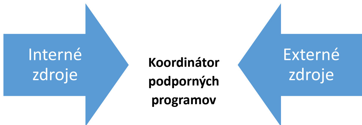
Schéma 2 Získavanie odborníkov - KPP

Z pohľadu nastavenia ďalšieho vzdelávania je, že bez ohľadu spôsobu regrutácie bude potrebné všetkých KPP do vzdelávať v oblasti implementácie rezolúcie Bezpečnostnej rady OS 1325 – Ženy, mier a bezpečnosť a v oblasti PONOŠ.